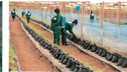
Huit abris de 500 m 2 et une pépinière de 200 m 2 pouvant être reproduits par les bénéficiaires et accueillant le dispositif de production hors sol pour une conduite optimale de l'exploitation