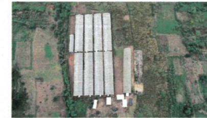
Site de formation et de production de 5 000 m 2 avec des équipements pour accompagner efficacement les bénéficiaires