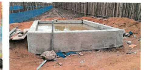
Un dispositif d'irrigation comprenant 8 fûts de 1 m 3 , une citerne basse de 15 m 3 et un système d'arrosage goutte à goutte permettant une gestion efficace de l'eau sur le site